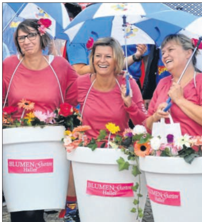
Die drei besten, also kreativsten, witzigsten Laufshirts beziehungsweise Verkleidungen werden wieder am Laufabend prämiert.

Auch in diesem Jahr wird ein Teil der Startgebühren für soziale Projekte in Hamm gespendet, die Summe geht an die WA-Aktion „Menschen in Not“. Die Startgebühr den AOK-Firmenlauf beträgt 9 Euro.