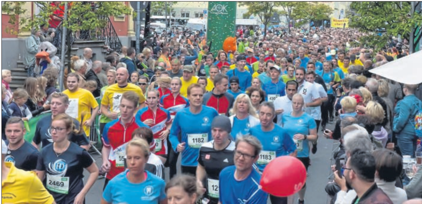
Über 6 400 Aktive aus 394 Unternehmen und Verwaltungen haben im vergangenen Jahr an dem Lauf teilgenommen. Er hat sich zu einer der größten Laufveranstaltungen in Hamm entwickelt.

Die Organisatoren gehen davon aus, dass viele Teams sich erst kurz vor „Torechluss“ anmelden werden. Das war auch in den letzten Jahren so. Den Meldeschluss sollten die Team-Captains